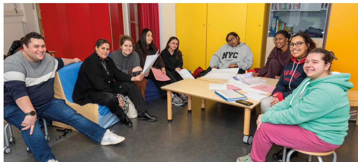
Équipe 3 Pom'

une sensibilité forte aux activités liées à l'environnement