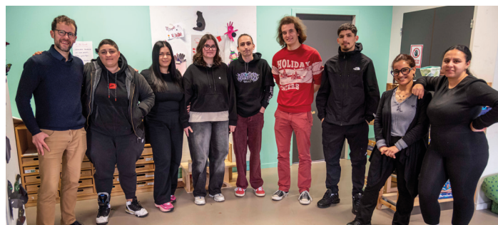
Équipe Romain Rolland & Château