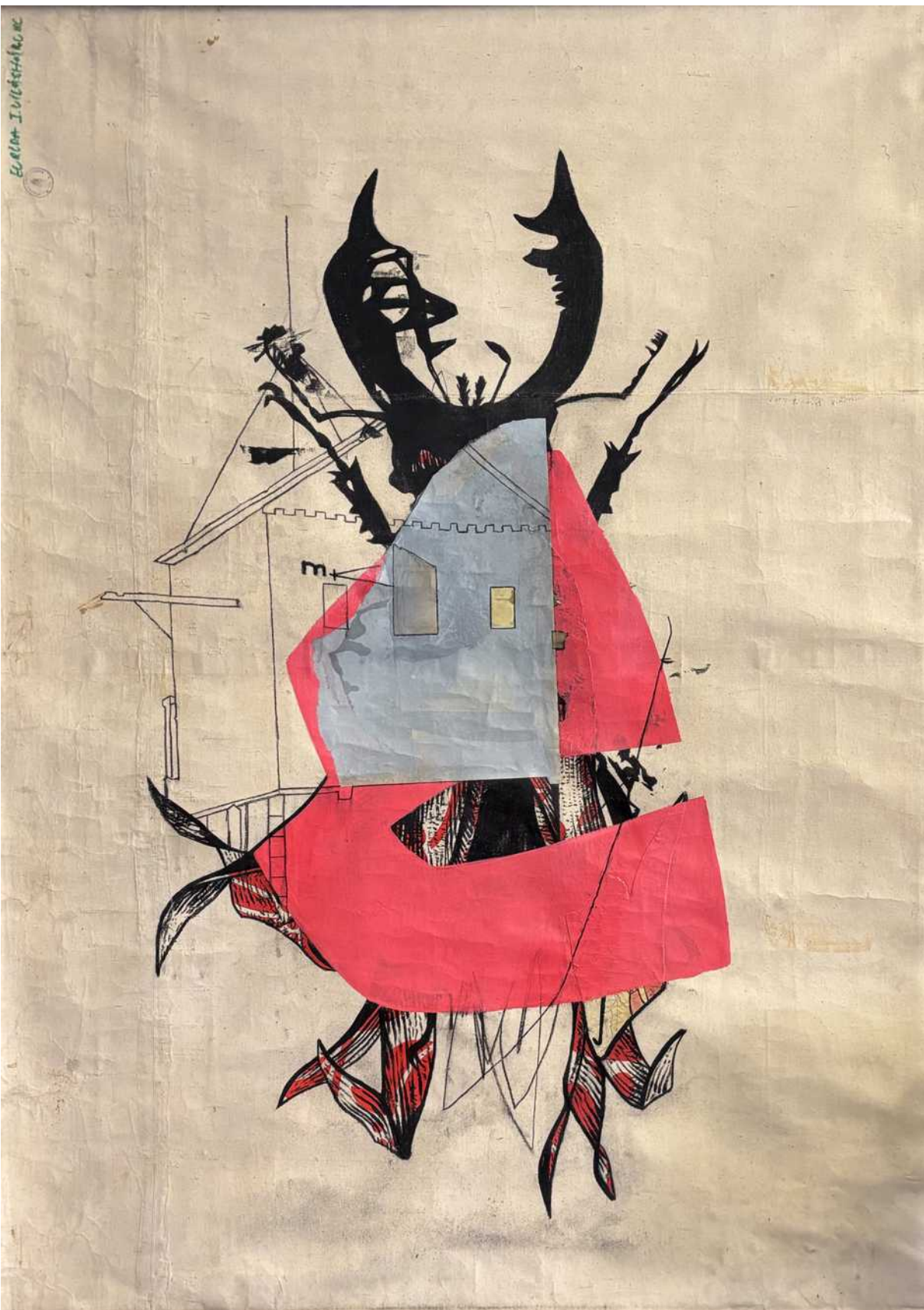
Can I go inside ? acrylique, huile, fusain, 150 x100, 2024

„i hope they let me in. after I took my favorite dress And i have my paper with me They suppose to let me in. I promise I will be a good citizen and I will turn down all the lights When its needed. »